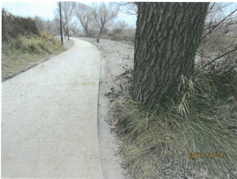
1. sz. fotó: 2016.12.21.-i állapot

A határozat két szakaszra: a 148-as busz fordulója és a déli közigazgatási határ között, valamint a Kis-Duna Öböl és a Dagi Csárda közötti szakasz felújítására biztosítja a megvalósításhoz szükséges forrásokat.