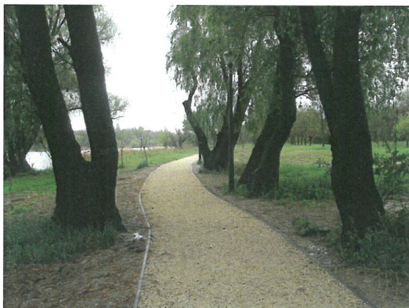
5. sz. fotó: 2017. április 20.