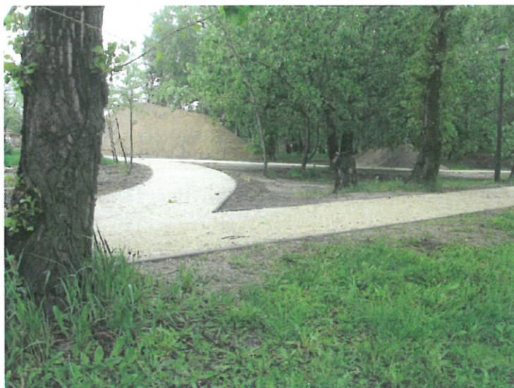
3. sz. fotó: 2017. április 20.