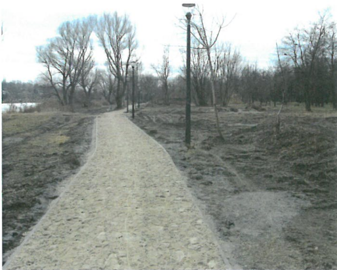
2. sz. fotó: 2017. február

Az irányváltásoknál íves kialakításban került megvalósításra a szegély, hogy az illeszkedjen a környezetbe, és így a régi nyomvonal vonalvezetését is sikerült nagy részben megtartani.