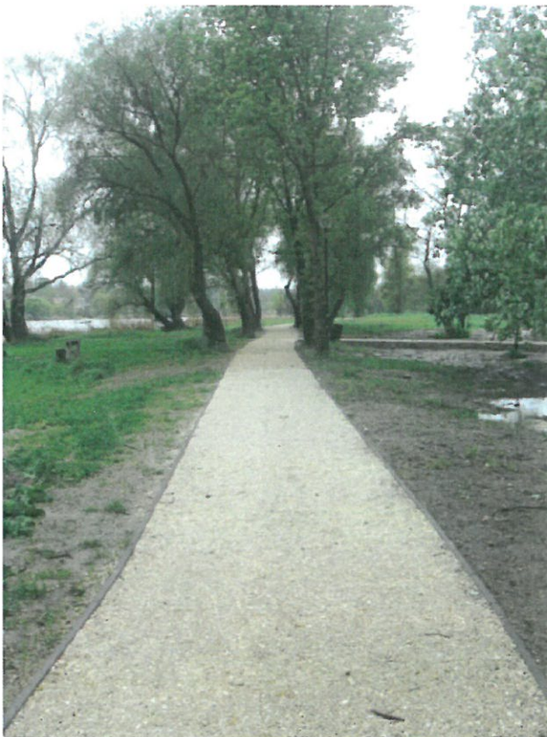
6. sz. fotó: 2017. április 20.

Az elkészült szakasz hossza (a déli közigazgatási határ és a Rév között a bekötőutakkal együtt) 1.400 m, mely a teljes építendő hosszának az 50 %-a.