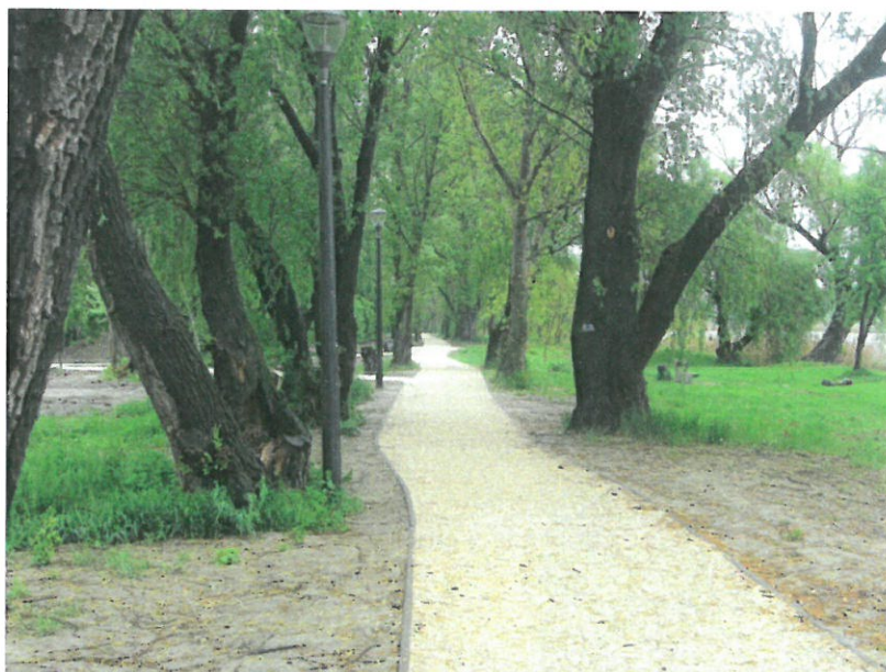
4. sz. fotó: 2017. április 20.