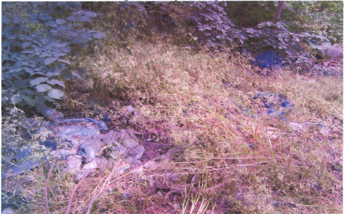
akácfa utca melletti illegális szemét