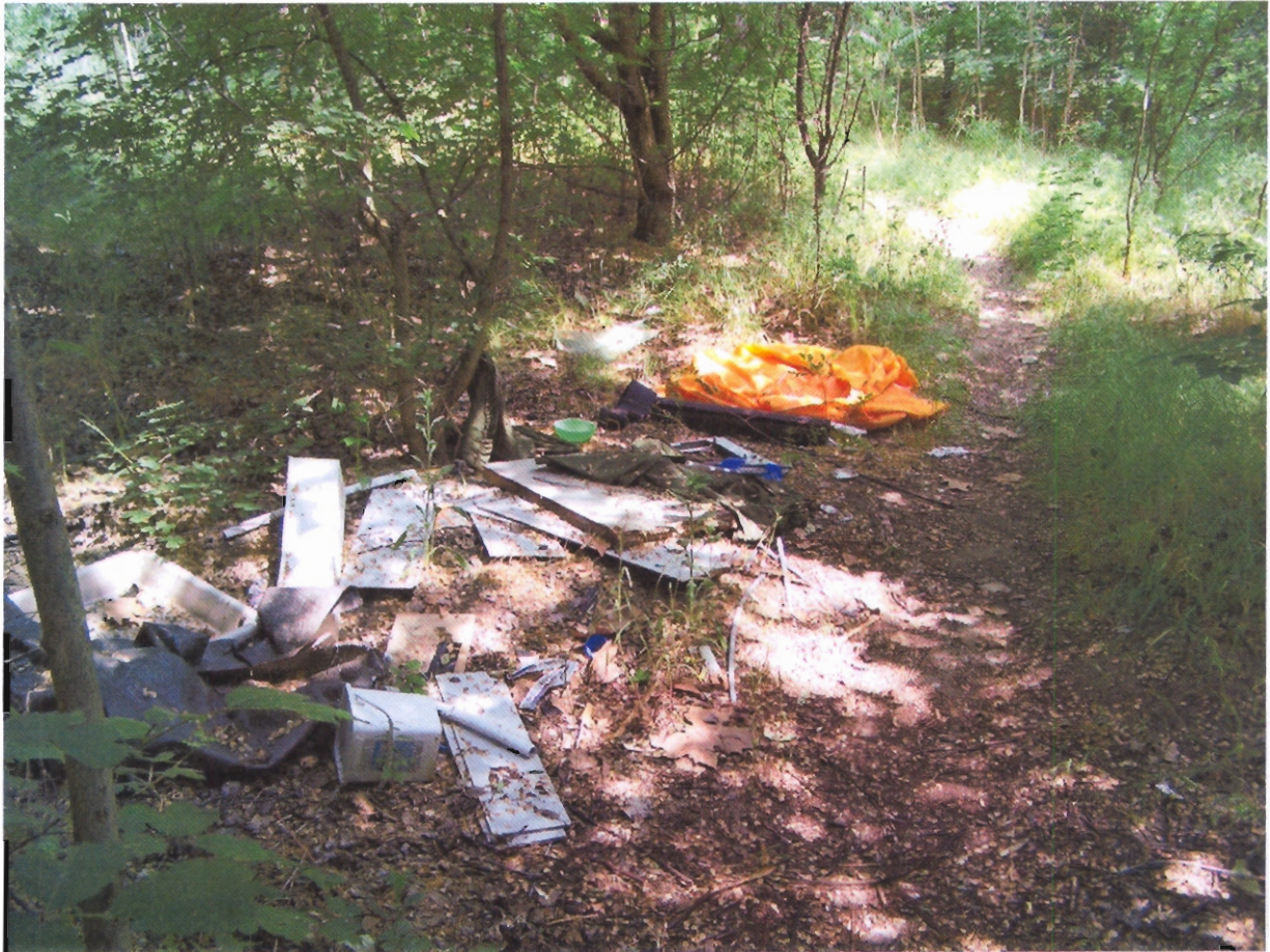
lakossági szemét a kitaposott ösvény mellett