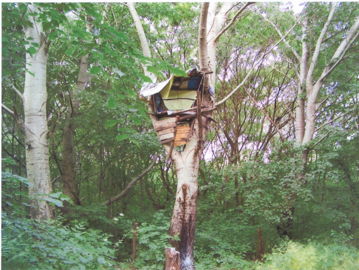
hajléktalan bódé a fán

Jelen pillanatban a terület szeméttel erősen terhelt, közjóléti infrastruktúrával nem rendelkezik, így közjóléti funkciót nem lát el.